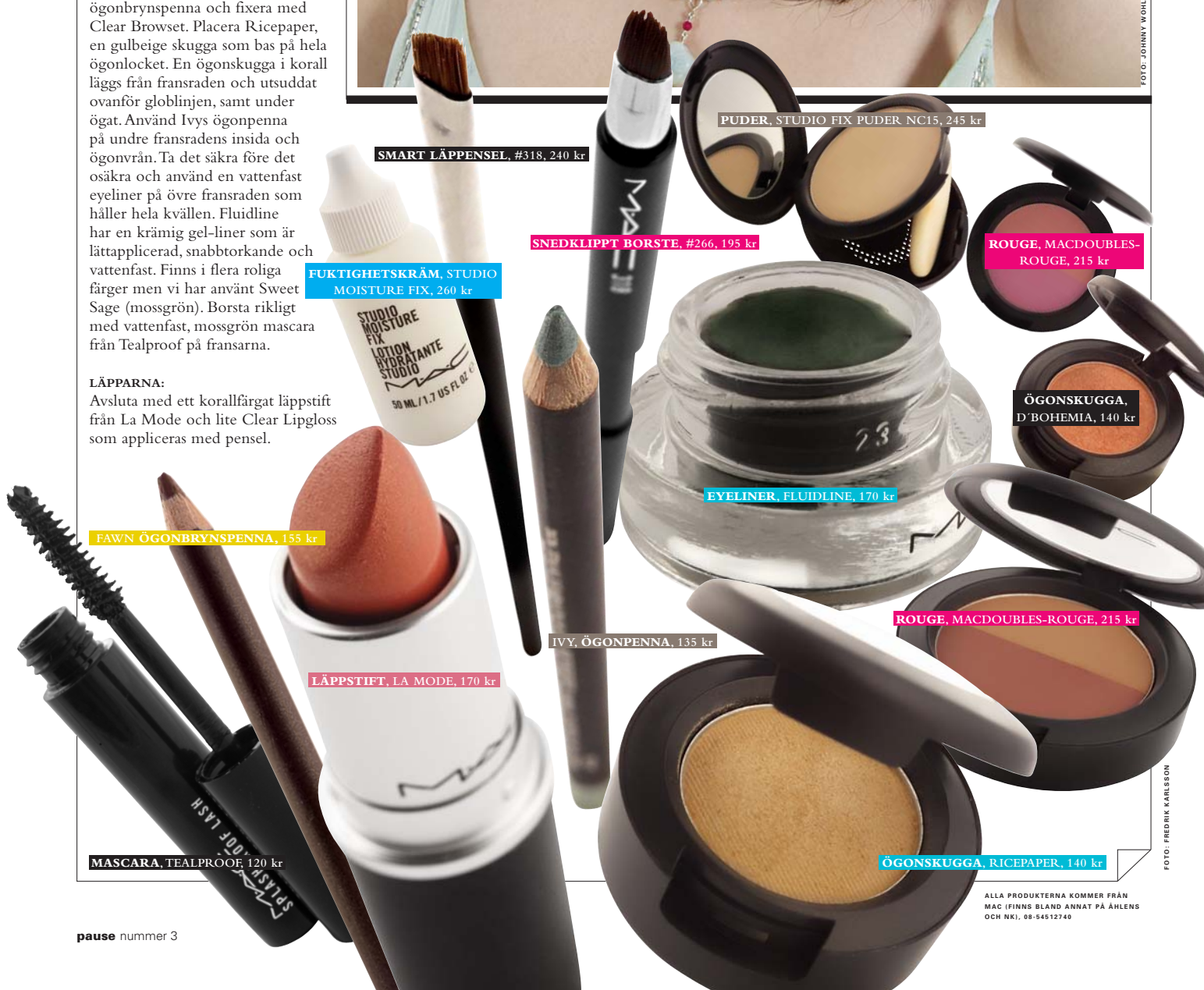
SMART LÄPPENSEL, #318, 240 kr